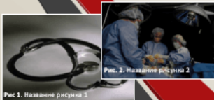
Рис. 1. Название рисунка 1